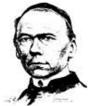
aus Kolping Schriften

Damit, dass Christus am Kreuze starb ..., waren die Menschen nicht aller Tätigkeit entbunden, keineswegs; vielmehr tritt jetzt erst die Forderung an sie heran, sich an den anzuschließen, der sich sühnend in ihre Mitte gestellt und der Versöhnung geworden für ewige Zeiten.