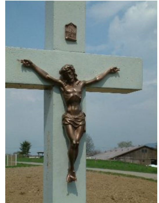
Kreuz am Tannenkircher Weg mit dem von der Kolpingsfamilie gestifteten Korpus.