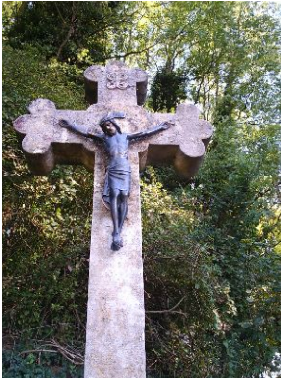
Unser ältestes Weg und Feldkreuz aus dem Jahr 1757