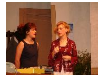
Bilder von 2002 / 2003

Die Kolpingsfamilie ist wieder an der Reihe mit dem Theater spielen.