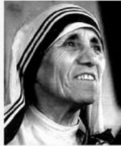
Mutter Theresa geboren: 27. August 1910, gestorben: 5. September 1997 Seligsprechung: 19. Oktober 2003

Die Leute sind unvernünftig, unlogisch und selbstbezogen, liebe sie trotzdem. Wenn du Gutes tust, werden sie dir egoistische Motive und Hintergedanken vorwerfen, tu trotzdem Gutes. Wenn du erfolgreich bist, gewinnst du falsche Freunde und echte Feinde, sei trotzdem erfolgreich. Das Gute, das du tust, wird morgen vergessen sein, tu trotzdem Gutes. Ehrlichkeit und Offenheit machen dich verwundbar, sei trotzdem ehrlich und offen. Was du in jahrelanger Arbeit aufgebaut hast, kann über Nacht zerstört werden, baue trotzdem. Deine Hilfe wird wirklich gebraucht, aber die Leute greifen dich vielleicht an, wenn du ihnen hilfst, hilf ihnen trotzdem. Gib der Welt dein Bestes, und sie schlagen dir die Zähne aus, gib der Welt trotzdem dein Bestes.