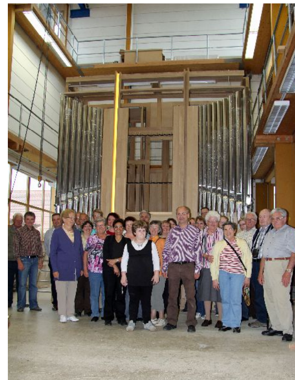
Unsere neue Orgel in der Werkstatt - Orgelfahrt 2012

verantwortlich leben solidarisch handeln